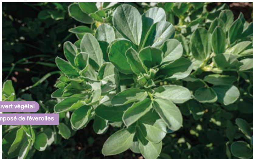
Couvert végétal composé de féverolles