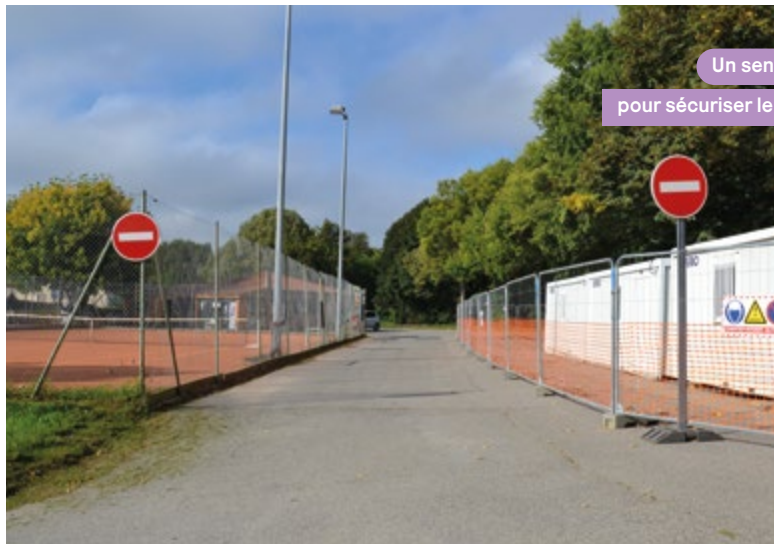
Un sens interdit pour sécuriser le chantier

Dans le cadre de la politique municipale de dynamisation de la base de loisirs, deux nouvelles structures de jeux pour enfants ont été apposées à proximité de l'ancienne plage (lire page 4).