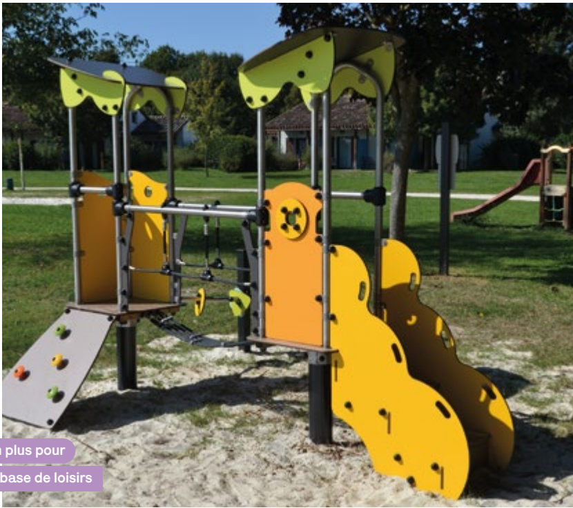
Un plus pour la base de loisirs