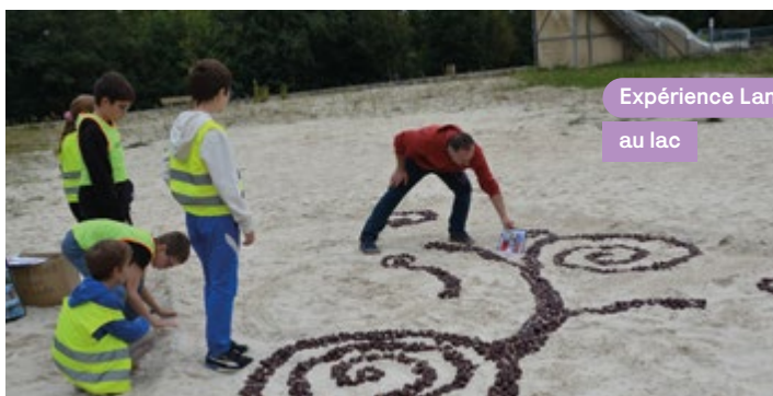
Expérience Land Art au lac

Le rendez-vous des geeks s'est tenu à la salle des fêtes le 2 novembre. Jeux vidéo, jeux de rôle, défilé costumé, conférence gesticulée, etc. Il y en avait pour tous les goûts et tous les âges à voir certains adultes se livrer à des parties endiablées devant les écrans.