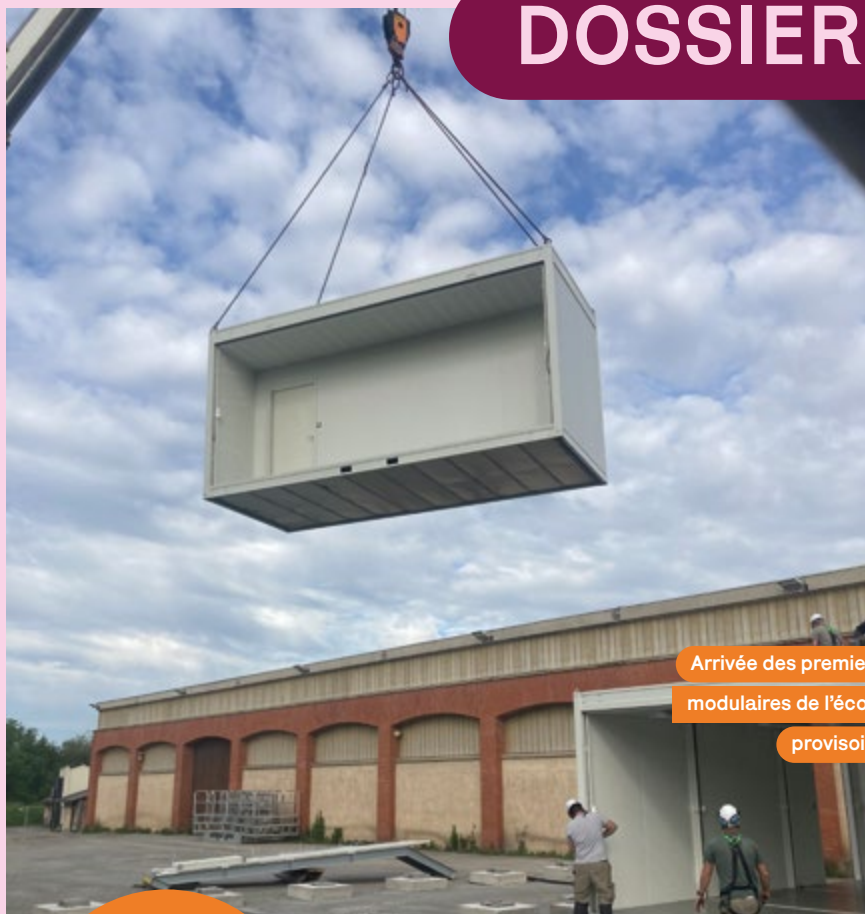
Arrivée des premiers modulaires de l'école provisoire